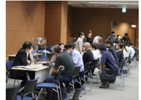
令和4年度合同企業説明会の様子