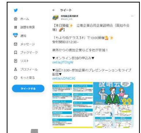
人材確保イベントをSNSで情報発信