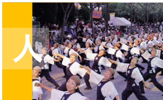
よさこい祭りに代表される人々の活気 おもてなしの心