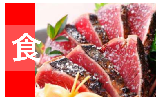
“食べ物のおいしいところ” 全国No.1