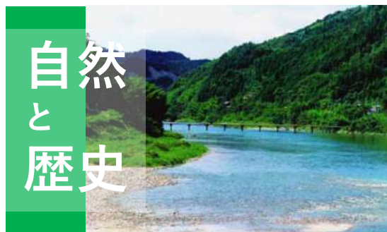
自然と歴史 四万十川 日曜市 坂本龍馬 岩崎弥太郎 牧野富太郎など